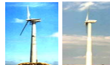
Windmatic 99 Windworld 150

L'achat: Via le contrat, 50% en bas, 35% de temps en temps de chargement, 15% équilibre sur Livraison. Les paiements doivent être faits dans Euros ou les Etats-Unis européens certifs les Dollars. Les prix cités sont dans Euros européen et sont sous réserve des cours de monnaie. S'il vous plaît confirmer des prix et la disponibilité avec nous avant prévu commandant la date.